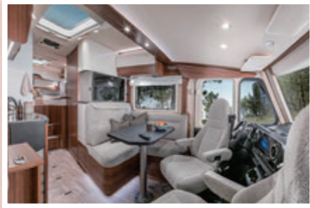
立ちながら、手足を伸ばして着替えられほど、天井も高く、各スペースが広いのがポイント。