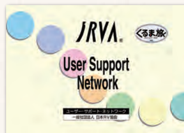
▲ ユーザー・サポート・ネットワークリスト

この機会に是非、日本RV協会 会員店でのキャンピングカー購入をご検討ください。日本RV協会 会員店はこちら ( https://www.jrva.com/members/ )