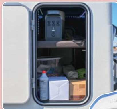
ナッツRV クレソンポヤージュ