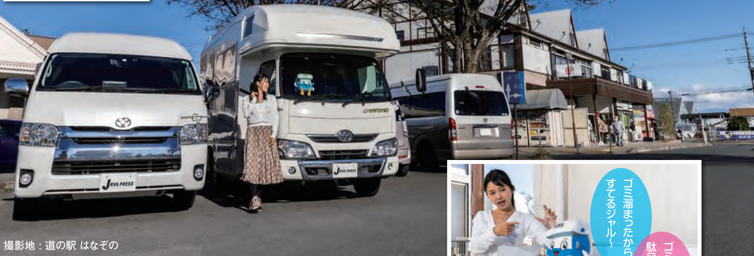
撮影地：道の駅 はなぞの