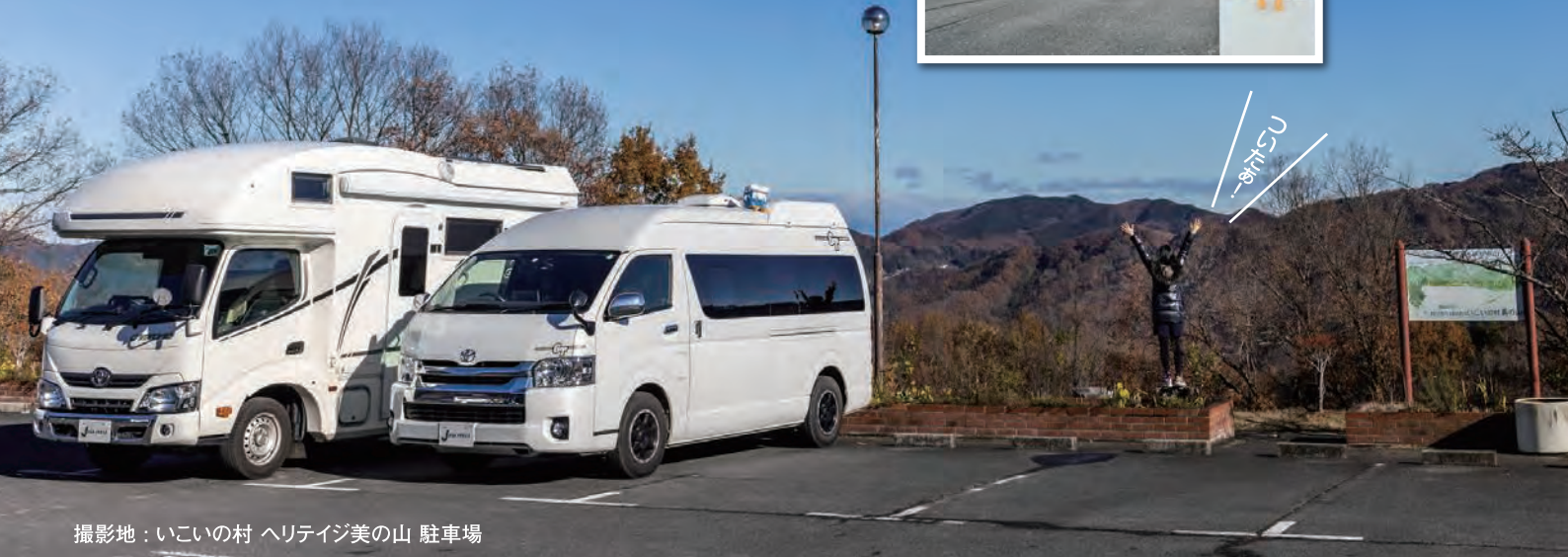
撮影地：いこいの村 ヘリテージ美の山 駐車場