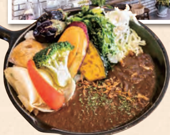
お姉さんが食べたのは地元野菜をふんだんに使った季節の深谷野菜カレー

住所：埼玉県深谷市小前田458-1 電話：048-584-5225 定休日：不定休