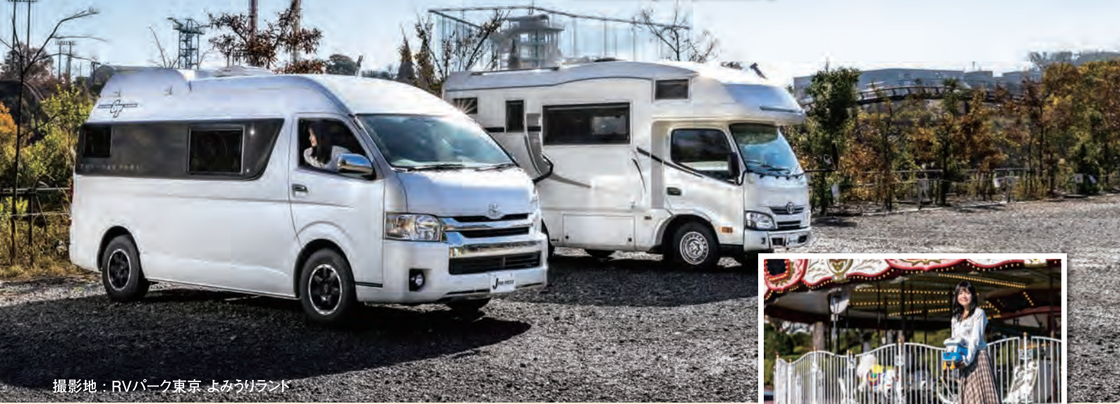
撮影地：RVパーク東京 よみうりランド