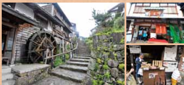
▲写真左は枅形の水車。写真右上は川上屋。写真右下は田中屋

枅形を過ぎると、道は直角に折れ曲がり、やがて右手に清水屋資料館が見えてくる。島崎藤村の作品『嵐』に出てくる登場人物の家で、藤村の書簡、掛け軸、写真などをはじめ、江戸期の生活道具などが保存され、この町でも貴重な文化遺産となっている。