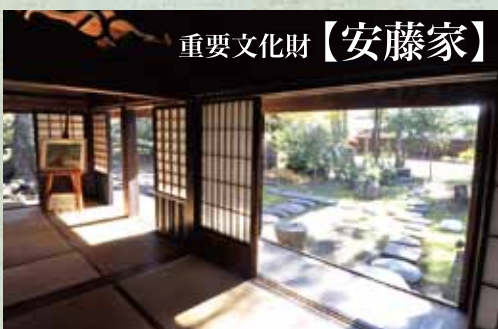
重要文化財【安藤家】

この「RVパークやまなみの湯」の近くに、1708年に建てられた昔の豪農の暮らしぶりを伝える由緒ある「安藤家」という国の重要文化財になっている建築がある。歴史的に意味があるだけでなく、伝統的日本家屋の美しさがよく分かるので必見。